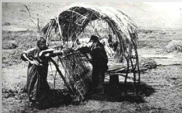
אריגה ליד טבריה 1894